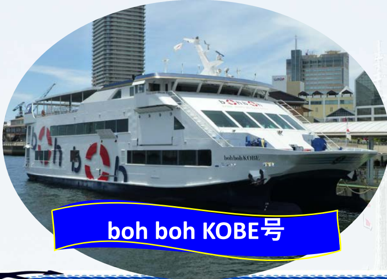
boh boh KOBE号

神戸港遊覧船に乗って、「みなとまちKOBEBE」の魅力や楽しさを体験するミニクルーズの参加者を募集します。