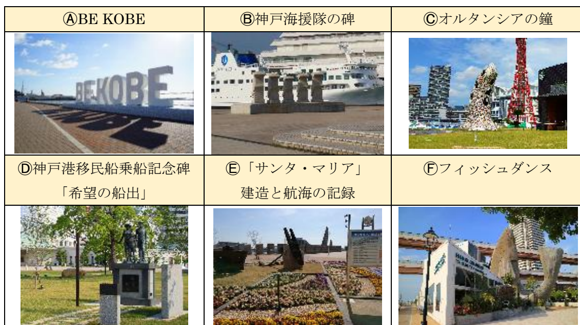
図4 主なモニュメント