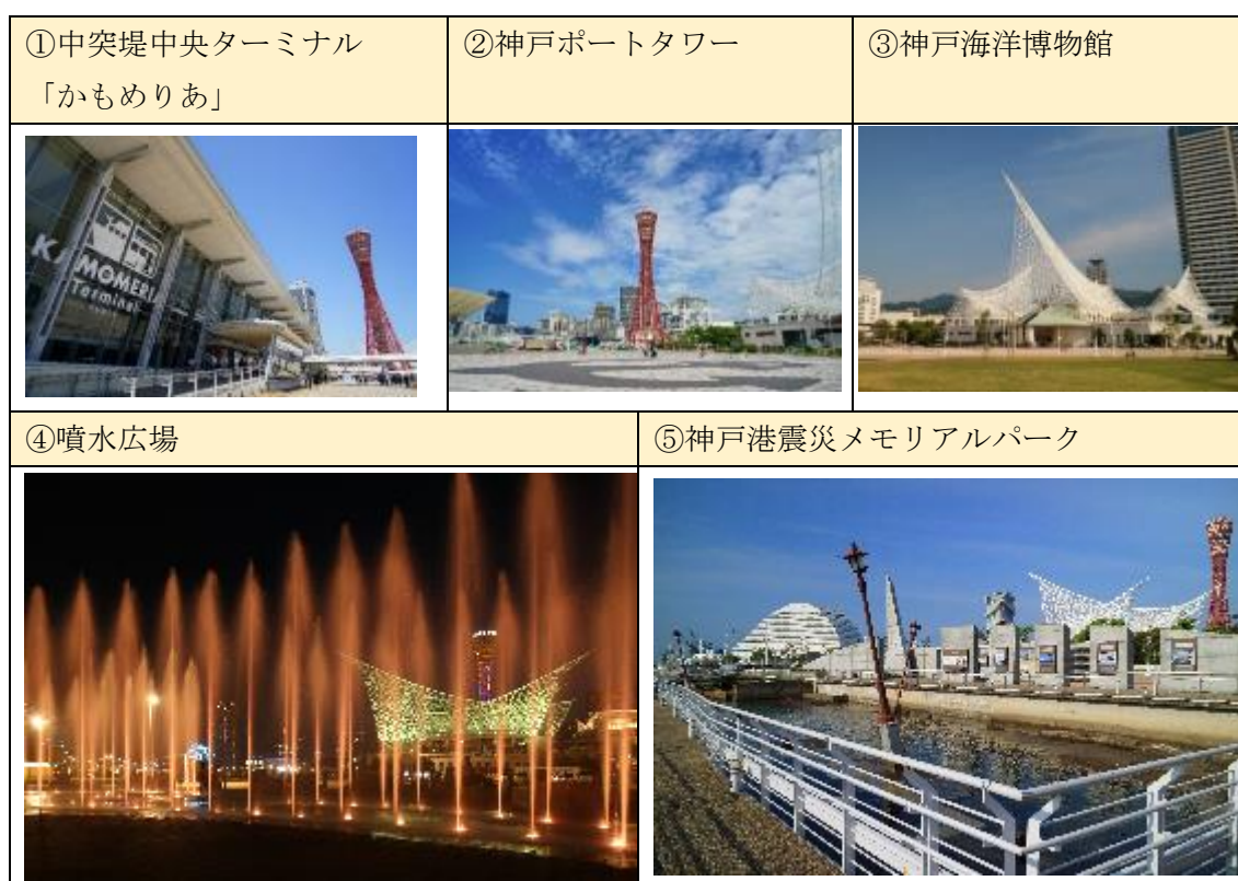
図2 主要な施設の様子