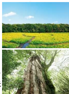
展海峰公園(イメージ)