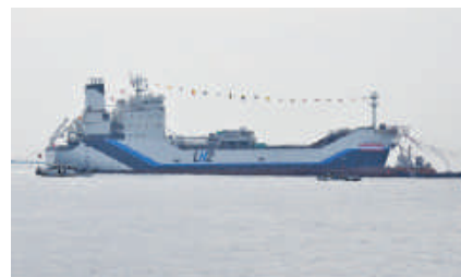
液化水素運搬船「すいそ ふろんていあ」

新しいエネルギーの選択肢として注目されている「水素」を液体状にして海上輸送する世界初の液化水素運搬船「すいそ ふろんていあ」の命名・進水式が12月11日に、川崎重工業神戸工場で行われました。