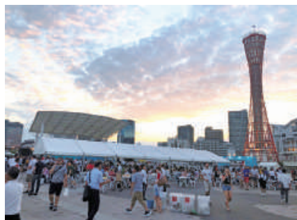
メリケンパークに出現したファンゾーン

ファンゾーンは、神戸会場で試合があった4日間とその間の土日計8日間開設。9月26日に行われたオープニング式典では、消防艇の放水などで開幕を祝いました。