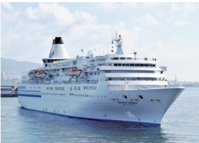
「ばしふいつくびいなす」(26,594総トン) 1月5日から計9回入港