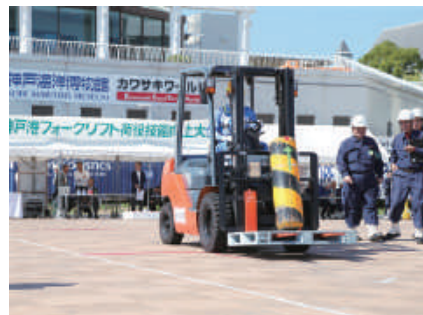
棒立てジグザグコース