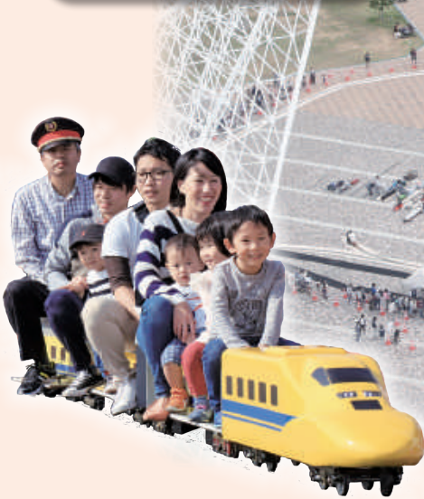
ミニ鉄道フェスタ 2019 (神戸メリケンパーク)

神戸海洋博物館 カワサキワールド KAWASAKI Good Times World