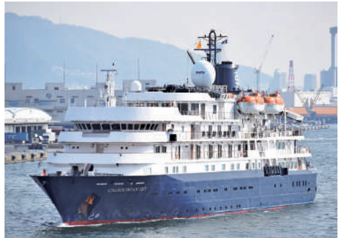
カレドニアン・スカイ 「CALEDONIAN SKY」(4,200総トン) 3月27日に入港