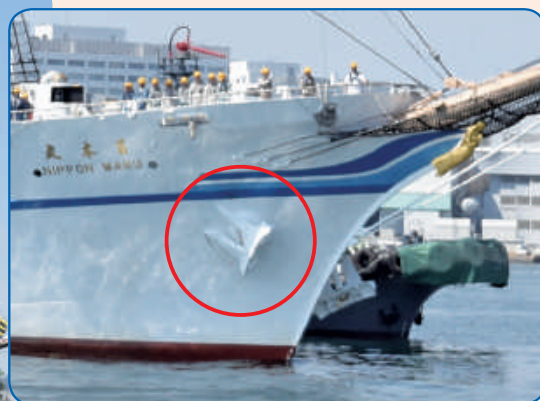
練習帆船「日本丸」錨