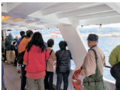
解説に耳を傾けながら灯台を見学する参加者ら