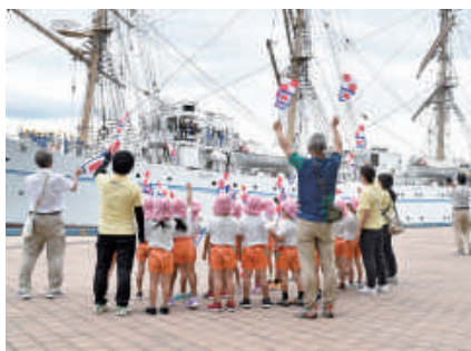
地元の幼稚園児もお見送り

11日(金)には、新港第一突堤で出港セレモニーを行い、歓送あいさつや花束贈呈、船長挨拶を行った後、多くの市民に見送られながら神戸を旅立ちました。