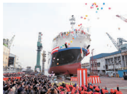
多くの人々に見送られ進水

当日は、関係者や来賓、市民の方々など約4,000人が新しい船が海上に浮かぶ姿を見守りました。