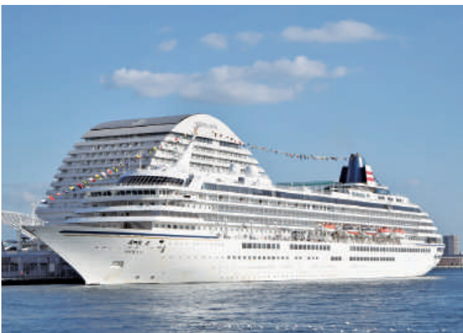
「飛鳥II」(50,142総トン) 3月24日から計2回入港