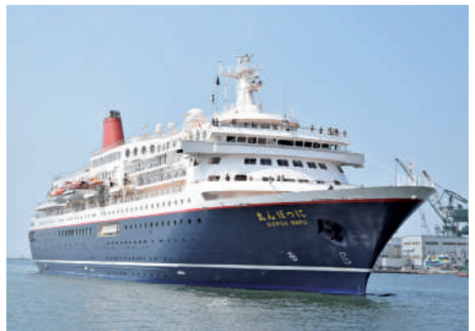
「にっぽん丸」(22,472総トン) 1月8日から計2回入港