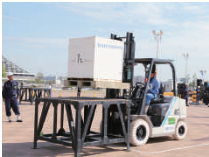
方向変換・屈折コース

神戸港の優秀なフォークリフト荷役技能をアピールするとともに、港湾労働災害の防止へ寄与することを目的とした「第35回神戸港フォークリフト荷役技能向上