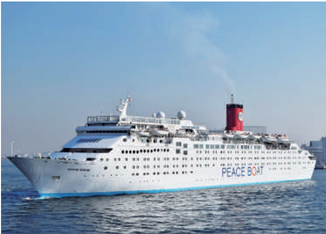
オーシャン・ドリーム 「OCEAN DREAM」(35,265総トン) 2月16日から計2回入港