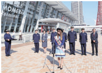
一日灯台長任命式

11月1日は日本初の洋式灯台である「観音崎灯台」(神奈川県横須賀市)が明治元年同日に起工された日で、海上保