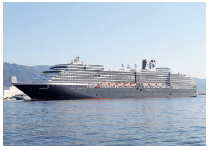
ウエステルダム 「WESTERDAM」(82,862総トン) 3月30日に入港