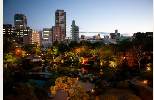
<「THE SORAKUEN」から見た相楽園の景色>

*灘五郷には26酒蔵があり、内1つは製造終了。本イベントにはそれを除く25酒蔵のお酒をご用意します。