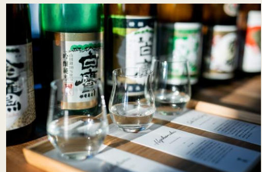
<少しずつ お好みで楽しめるスタイル>