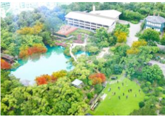
<THE SORAKUEN (中央上部)>

事業紹介 レストラン「相楽」 兵庫県産を中心に旬の美食を楽しむ完全予約制のプライベートレストラン カフェ「相楽園パーラー」 四季折々の美しさに彩られた庭園を眺めながら、心地よい時間を過ごせるカフェ ウェディング 歴史や自然を贅沢に感じながら行う、一日二組限定の結婚式 宴会・会議・イベント 由緒ある“神戸の迎賓館”で美食と眺望を愉しむ特別感のあるイベント・パーティ