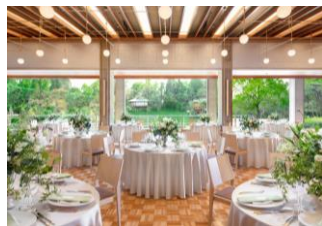
<バンケット「パークスイート」>