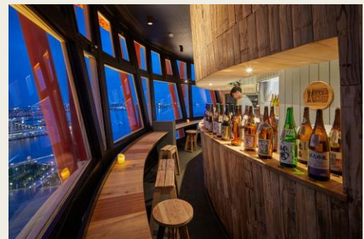
<ポートタワー内「SAKETARU LOUNGE」とコラボ>