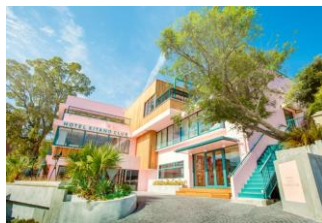
<ホテル北野クラブ>