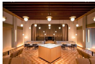
<カフェ「相楽園パーラー」>