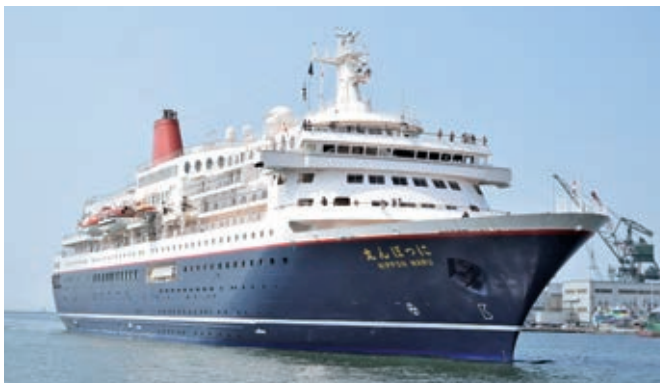
「にっぽん丸」 (22,472総トン) 10月18日から計5回入港