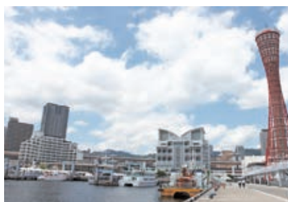
中突堤にずらりと船艇が停泊

神戸港ボート天国は、市民に港や海・船への親しみを深めてもらい、海洋性スポーツの振興と海事思想の普及、さらには海難事故の防止にも寄与することを目的として、平成2年より開催しています。今年も7月15日(月・祝、海の日)、「第18回Kobe Love Port みなとまつり」の一環行事として、メリケンパーク東護岸と中突堤・かもめりあ周辺で開催しました。