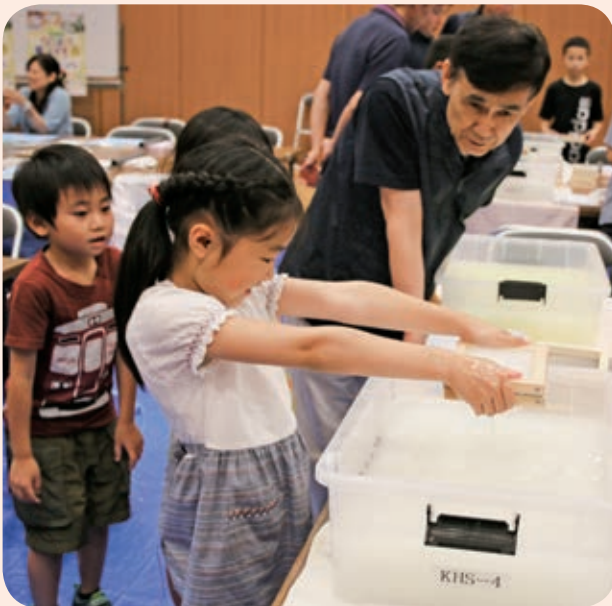
コツは木枠を水平に保つこと!