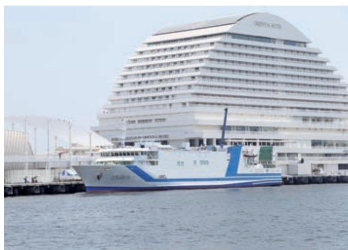
「船上劇場 STU48号」神戸港へ初入港 (2019.7.30)