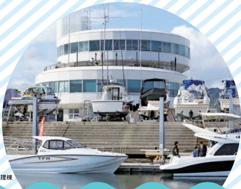
須磨ヨットハーバー管理棟