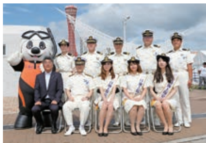
1日海上保安部長任命式

神戸港ボート天国は、市民に港や海・船への親しみを深めてもらい、海洋性スポーツの振興と海事思想の普及、さらには海難事故の防止にも寄与することを目的として、平成2年より開催しています。今年も7月15日(月・祝、海の日)、「第18回Kobe Love Port みなとまつり」の一環行事として、メリケンパーク東護岸と中突堤・かもめりあ周辺で開催しました。