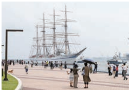
多くの人びとに見送られ、神戸を出発

神戸市港湾局みなと振興部長の挨拶に続き、マリンメイトから船長・実習生代表への花束贈呈、船長挨拶が行われ、神戸港をあとにしました。