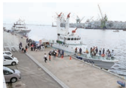
巡視船「ふどう」の甲板に乗る参加者

消防艇「たかとり」、漁業実習船「但州丸」、漁業取締船「白鷺」、海面清掃兼油回収船「Dr.海洋」、監視艇「こうべ」、海面清掃船「清港丸」等で行い、約6,000人の市民が訪れました。