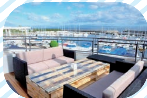
3F・オープンテラス