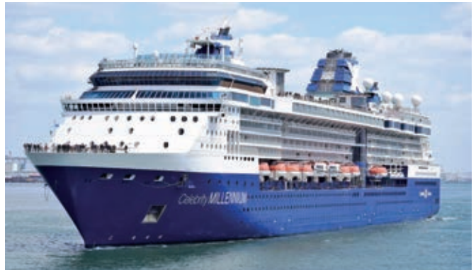
セレブリティ・ミレニアム 「CELEBRITY MILLENNIUM」 (90,963総トン) 10月14日から計4回入港