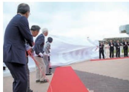
新たなランドマークの除幕式

新しく設置されたポーアイしおさい公園は、以前はコンテナヤードでしたが、神戸開港140年記念事業で整備された緑