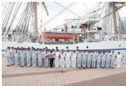
出港セレモニーの風景

8月19日(月)から24日(土)まで、練習帆船「日本丸」と、練習船「青雲丸」が、新港第一突堤西岸壁に入港しました。台風10号の影響で両船とも入港時間を変更したため、19日に予定されていた入港セレモニーは中止になりましたが、神戸市、神戸観光局、神戸海事広報協会では、24日に送港送迎セレモニーを開催しました。