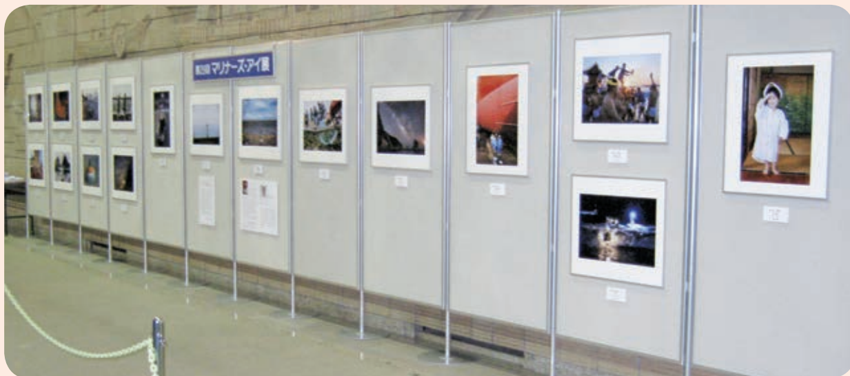
(写真は昨年の展示)

今回、神戸海洋博物館では入賞作品17点が展示されています。なかでも北海道斜里郡で撮影された大賞作品の「流水上に煌く星空」は、最果ての北の大地と流水が漂着した海、その上に広がる星空という雄大な作品です。会期は、10月10日(木)まで。(10:00~17:00 最終入館は16:30まで、月曜日休館)