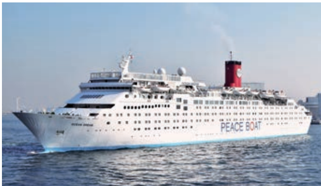
オーシャン・ドリーム 「OCEAN DREAM」 (35,265総トン) 12月12日から計2回入港