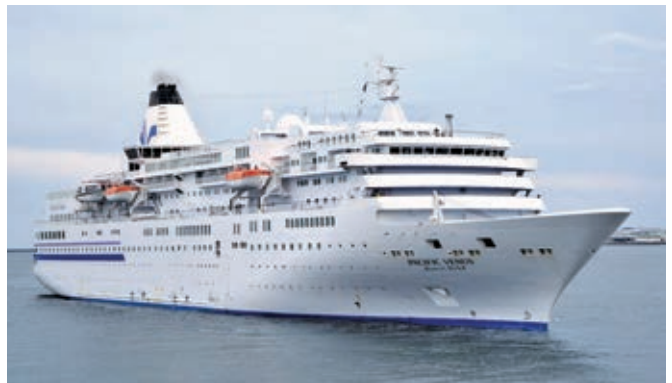
「ぱしふいっくびいなす」 (26,594総トン) 10月14日から計14回入港