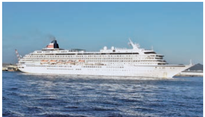
「飛鳥II」 (50,142総トン) 11月19日から計5回入港