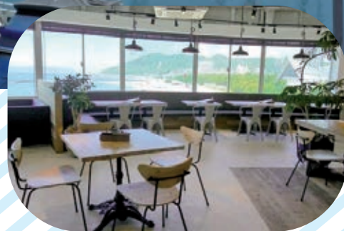
4F・レストラン店内

神戸市立須磨海浜水族園のすぐ隣、須磨海岸の東端にある管理棟内のレストラン「NORTHSHORE 須磨ヨットハーバー店」は4Fが店内レストラン、3Fはバーベキューのできるオープンテラスとなっており、美しい須磨海岸や明石海峡大橋を望む神戸屈指のベストビュースポット。クルーズに観光にグルメに、須磨ヨットハーバーにぜひ遊びにいらしてください。