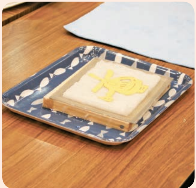
講師の手作りスタンプではがきのデザインを

初めて牛乳パックでできた種を触った子どもたちは「めっちゃもちもち!」と驚き、作り上げたはがきに丁寧に色つけしました。