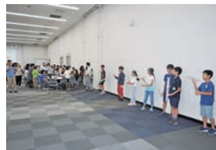
ロケット飛ばしかな?

理科授業では、ロケットが飛ぶ仕組みを学んだあと、傘袋ロケットを作り、みんなで飛ばしました。その後は工場見学会を行い、28組56名の親子が楽しみました。