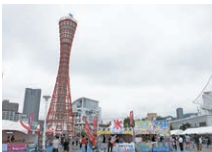
広場にずらり並ぶ屋台

メリケンパークにはご当地グルメや国際フードが楽しめるエリアや、420張の提灯で「BE KOBE」の文字を表現する提灯モニュメントのコーナー設けられ、会場を彩りました。