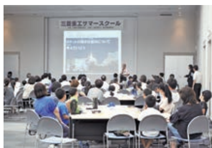
まずは親子で講義を受講

三菱重工株式会社神戸造船所と神戸観光局では、夏休み期間中の8月21日(水)に、「三菱重工しんせんサマースクール」を開催しました。4年生以上の小学生とその保護者を対象に、ものづくりや先端技術に興味を持ってもらうことを目的として毎年開催しているイベントで、実験を交えた理科授業と工場見学会を行いました。