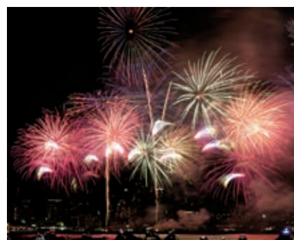
神戸港を染める色とりどりの花火

今年の花火は6,500発。神戸ポートタワーをイメージした赤い花火からスタートし、「花鳥風月」「輝きの海と空」など6つのプログラムが披露され、ミナト神戸の夜空を華やかに彩りました。