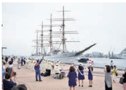
見送りは神戸市消防音楽隊の演奏で

6月8日(土)から神戸港で純白の船体を休めていた大型練習帆船「海王丸」が、7月5日(金)、新たな実習訓練のため神戸港から出港しました。出港セレモニーで歓迎挨拶や花束贈呈、船長挨拶を行った後、多くの市民に見送られながら、神戸を旅立ちました。実習生は清水港、宇野港、四日市港、小樽港、苫小牧港を経て、9月9日(月)の横浜港までの約3か月間、国内沿岸の航海訓練を行います。