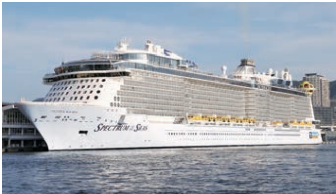
スペクトラム・オブ・ザ・シーズ 「SPECTRUM OF THE SEAS」 (169,379総トン) 10月4日から計3回入港