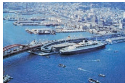
初入港した「QUEEN ELIZABETH 2」(65,863G/T)

QE2の神戸港への寄港は、①1975年(昭和50)3月5日、②1978年(昭和53)3月20日(65,863G/T)、③1983年(昭和58)3月21日(67,140G/T)、④1993年(平成5)3月22日(69,053G/T)、⑤1997年(平成9)3月3日(70,327G/T)、⑥2001年(平成13)3月1日、⑦2006年(平成18)3月6日が最後の入港となりました。